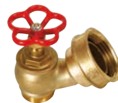
Figura 2: attacco filettato gas M, uscita filettata UNI F con girello.