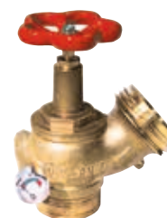
Figura 3: attacco filettato gas M, uscita filettata UNI M con manometro.