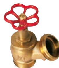
Figura 1: attacco filettato gas M, uscita filettata UNI M.