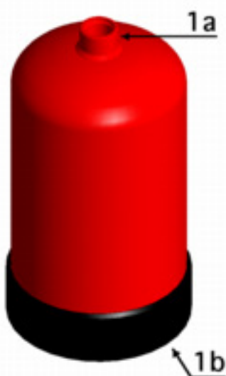
Figura 2: Serbatoio per estintore portatile

In questo modello, vi è un unico serbatoio A, in cui è posto l'agente estinguente D in una atmosfera di gas propellente. La valvola B, cui è connessa la manichetta C, è avvitata o comunque fissata in modo non permanente al serbatoio; su questo è apposta una etichetta E.