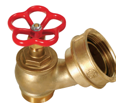
Figura 2: attacco filettato gas M, uscita filettata UNI F con girello.