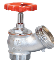
Figura 4: attacco filettato gas M, uscita filettata UNI M cromato.