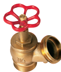
Figura 1: attacco filettato gas M, uscita filettata UNI M.