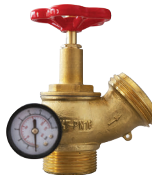
Figura 3: attacco filettato gas M, uscita filettata UNI M con manometro.