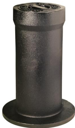
Fig. 1: Chiusino «presa acqua»