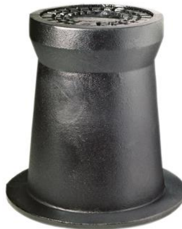
Fig. 2: Chiusino «saracinesca»

Chiusini in ghisa con coperchio con scritta «presa» (fig.1) e «saracinesca» (fig.2), verniciati neri.